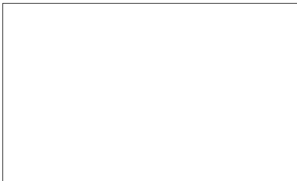
Graf 3: Podíl občanů, kteří vědí o existenci preventivních aktivit ve městě (dle názoru manažera prevence)

Každý pátý respondent se domnívá, že o přítomnosti nějakých preventivních snah ve městě ví méně než čtvrtina občanů; třetina respondentů má za to, že je to asi čtvrtina až polovina občanů. Téměř polovina dotázaných je velmi optimistická a soudí, že propagace preventivních akcí byla natolik účinná, že zasáhla 50 – 90% populace města.